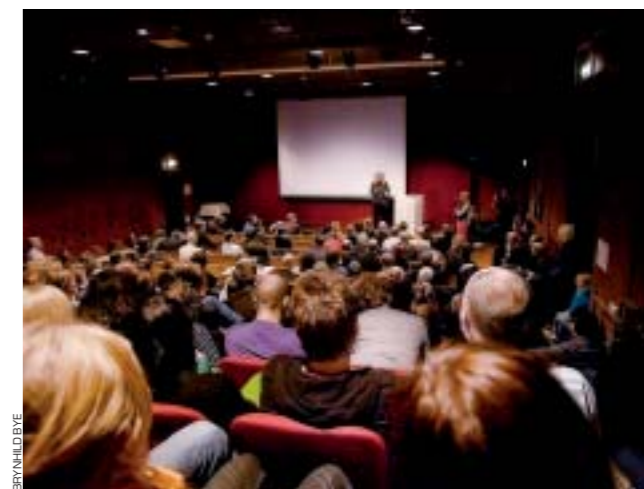
В мастер-классе агентства Magnum приняли участие более ста человек, а на вечерних презентациях, открытых для публики, порой было негде присесть